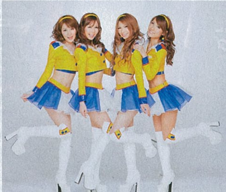
エンジェルのように飛んでいきそうだ

2010年 アップガレージの黄色をメインテーマに青いボタンや白フリルでアクセント