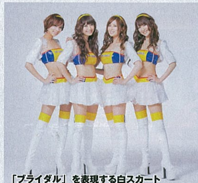
「ブライダル」を表現する白スカート

2012年 元気で可愛いドリエンをグレードアップさせる、襟元とスカート裾の花飾りがポイント