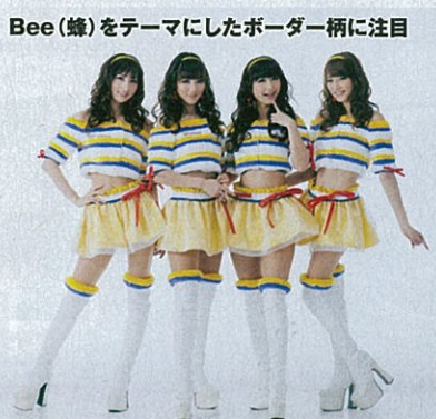
Bee(蜂)をテーマにしたボーダー柄に注目

2013年 白レースを使ったスカートが最大ポイント。ピアスやネックレスなどのパールも!