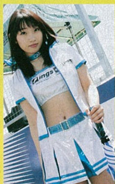
'05年のイングス。衣装の感じは今とほぼ同じ