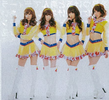
スカートなどの花飾りが効果的です

2011年 バレリーナのチュチュ素材で作ったスカートや襟など可愛らしいフワフワ感を演出