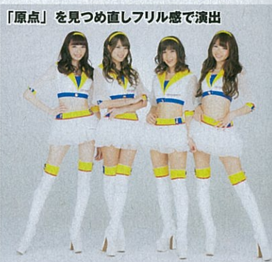
「原点」を見つめ直しフリル感で演出

2014年 従来とは違う可愛らしさを表現するため黄色を取り込んだ、キャラクター性を演出